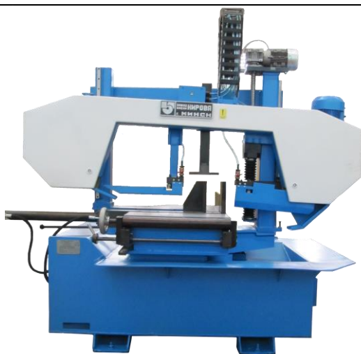
Ленточно-отрезной полуавтоматический станок модели МП6-1970