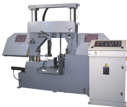
Ленточно-отрезной автоматический станок модели МП6-1920-001

Электросхема управления циклом работы станков построена на базе программируемого контроллера (ПК).