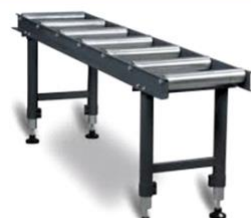
неприводные рольганги длиной 2м (по заказу)