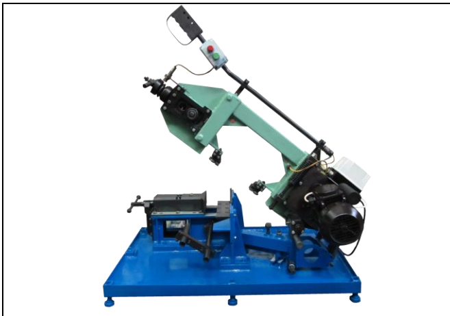
Ленточно-отрезной ручной настольный станок модели МП6- 1954-001