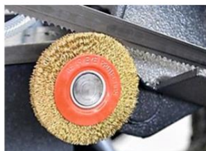
щетка для очистки ленточной пилы от стружки