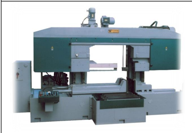
Ленточно-отрезной автоматический станок модели МП6-1922-001